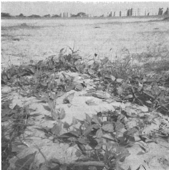
sur sable dunaire, à Saint-Louis, Sénégal.

A Saint-Louis, au Nord Sénégal, nous avons tenté à plusieurs reprises de faire accepter à l' Euryope rubra la pervenche de Madagascar : Catharanthus (= Vinca ) roseus (L.) et Calotropis procera Ait. L'Apocynacée et l'Asclépiadacée ont été complètement rejetées par l'Insecte même affamé. Nous n'avons pas tenté d'expérience avec le Nerium , mais ce dernier n'était jamais parasité dans la nature par l' Euryope . En définitive, E. rubra est strictement monophage