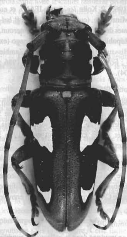
Cliché 1 – Prosopocera (Alphitopola) imitans n. sp. Holotype de Kingélé, Gabon.