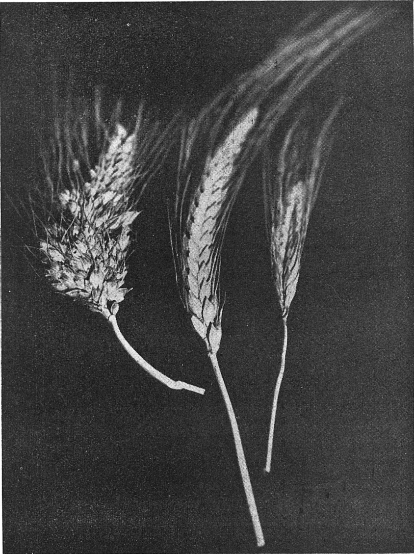
Seconde expérience (Joseph TUJAGUE). Première génération. A gauche : Triticum turgidum compositum témoin. A droite : Triticum timopheevi témoin. Au centre : l'hybride ( Tr. turg. compositum × Tr. timopheevi ) F 1 . (Photo M. STROUN).

Notre ami Joseph TUJAGUE, sur la base des suggestions que nous avons publiées en 1952 a procédé au croisement sexuel, après rapprochement végétatif préalable, entre Triticum turgidum compositum (forme maternelle) et Triticum timopheevi (forme paternelle). Ses expériences ont été menées aux environs d'Auch (Gers).