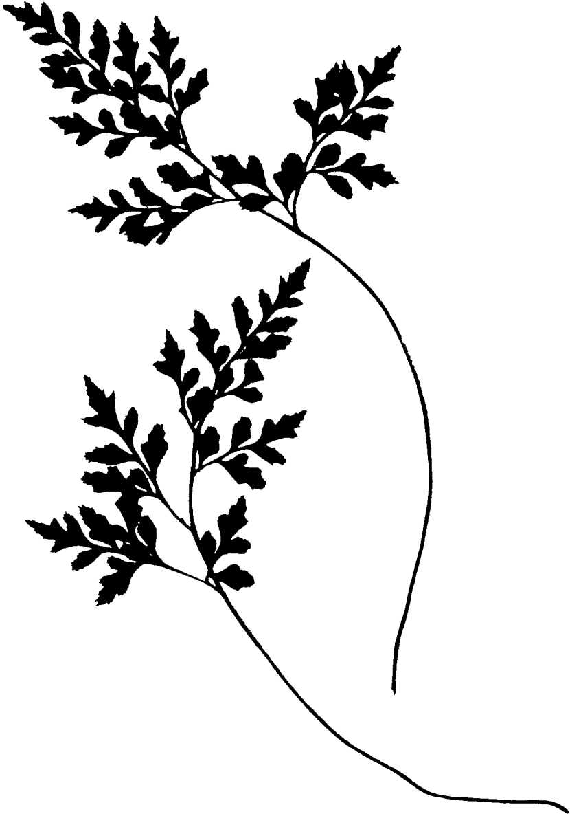
Planche 2 : photocopies de deux frondes d' Asplenium cuneifolium provenant du Suc de Clava (P.B. 2159).

Asplenium cuneifolium Viv. est une fougère, elle, strictement serpentini- cole. La rareté des affleurements de serpentine explique déjà sa rareté cor- rélatrice. En Europe, un certain nombre de stations ponctuelles, toutes sur serpentine, ont été attribuées à cette espèce. Ces stations se répartissent depuis la Galice à l'ouest jusqu'à la Roumanie à l'est, et de la Pologne au nord jusqu'au sud de la Grèce (JALAS & SUOMINEN 1972).