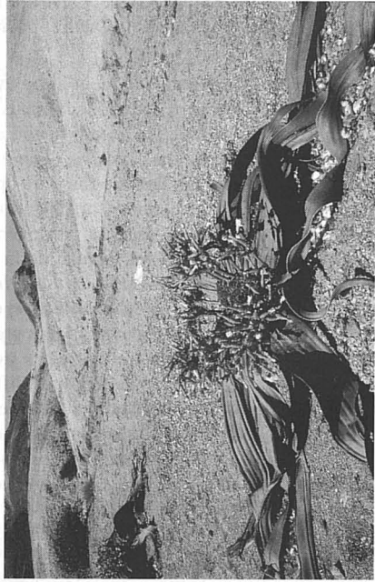
Welwitschia mirabilis Hook., environs de Swakopmund (Namibie)