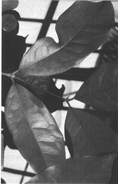
Gnetum gnemon L., Jardin botanique de Lyon