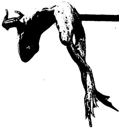
FIG. 2. — Grenouille léthargique demeurant en équilibre sur une tringle horizontale.

LÉTHARGIE. — L'animal en état de léthargie est, comme dans l'état de catalepsie, immobile et insensible à ce qui se passe autour de lui. Sa peau est pâle. La respiration est superficielle, au point d'être insensible. Les paupières sont closes. L'analgésie, sans être absolue, est très profonde. Le sens kïnsthésique est aboli. Tandis que la grenouille normale placée sur