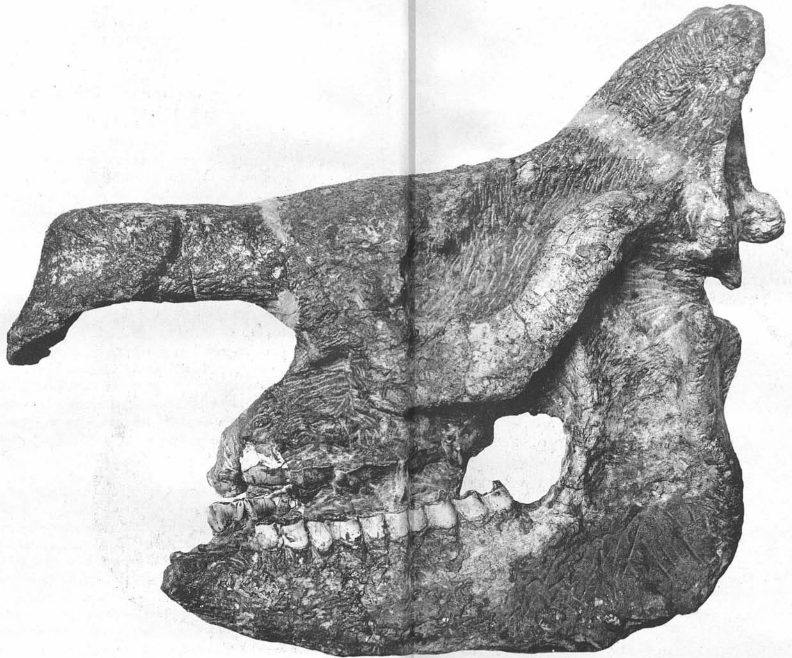
RHINOCEROS LEPTORHINUS, CUVIER. — Réduction, : 1/4.