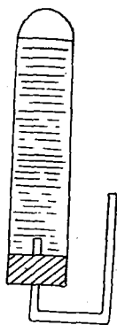
FIG. 1. — Dispositif pour étudier le dégagement d'oxygène.

c) Formation d'amidon. — Les Euglènes, à la lumière, accumulent en abondance une substance ternaire, isomère de l'ami-