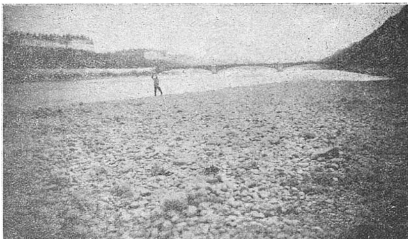
Fig. 2. — Plage de galets émergée en période de très basses eaux (station II).

STATION III. — Elle est située sur la rive gauche, un peu en amont du pont de la Guillotière. Des galets de 5, 10 cm et plus, forment un dépôt qui descend en pente assez forte dans le Rhône. Le courant atteint une vitesse de 50 à 70 cm/s. Le banc de graviers est tronqué à son extrémité aval ; sur cette face, le courant est moins fort. Les galets portent Chaetophora et Oscillatoria . On rencontre aussi quelques rares plants de Myriophyllum .