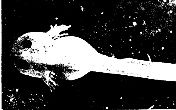
Fig. 2. — Têtard dépigmenté (stade branchies externes). \times 10 .

Après quelques jours les jeunes têtards commencent à s'assombrir et au bout de deux semaines il est difficile de distinguer ceux des 2 lots (témoin et albinos) placés dans les conditions nyctémérales normales. Néanmoins une différence de coloration qui se maintient jusqu'à la métamorphose existe, cette différence est encore plus nette chez les larves exposées à 4 000 lux de façon permanente ainsi que chez celles qui sont soumises à l'obscurité continue. Nous avons très nettement observé que les têtards normalement pigmentés adaptent leur livrée aux conditions d'éclairage de l'expérience. Illuminés continuellement (4 000 lux), ils sont beaucoup plus sombres que leurs homologues placés à l'obscurité.