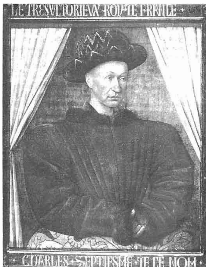
CHARLES VII (1403-1461)

L'entreprise marcha d'abord sans anicroche, mais tout se gâta quand le jeune roi CHARLES VII exigea des monnayeurs une monnaie de plus en plus abondante. Au mois de juin 1429, c'était l'époque de la brillante campagne de Jeanne d'ARC, qui demandait une mise en œuvre continue.