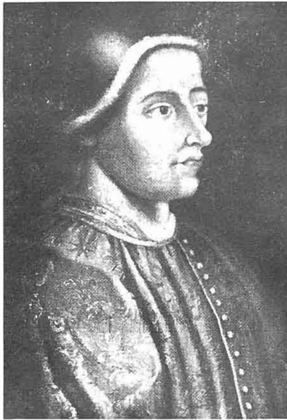
Jacques CŒUR (1400-1456)

Trois cents facteurs travaillaient sous ses ordres ; il les choisissait avec discernement. Bourges, sa ville natale, était le centre nerveux de son entreprise, mais il possédait des immeubles en maintes villes et des comptoirs aux Pays-Bas, en Ecosse, en Angleterre, en Italie et en Catalogne.