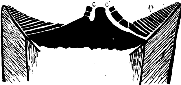
Fig. 1. — Yvania maestrichtiensis Milovanovic. — Coupe longitudinale ; c et c', canaux de l'excroissance ; p, pores, en réalité orifices des canaux fins traversant la valve. Gr. naturelle. Maestrichtien de Bacevica, Serbie orientale. (Copie du dessin schématique de l'auteur).

8°. Citons pour mémoire les variations d' Yvania maestrichtiensis Milovanovic (9), fig. 2-3 — (17), fig. 16 — fig. 1) chez lequel la réduction à deux unités des grands canaux de la valve gauche constitue une régression. La prolongation des pores du limbe par des canalicules débouchant sur la face interne du biseau de la même valve constitue par contre une variation tout à fait spéciale.