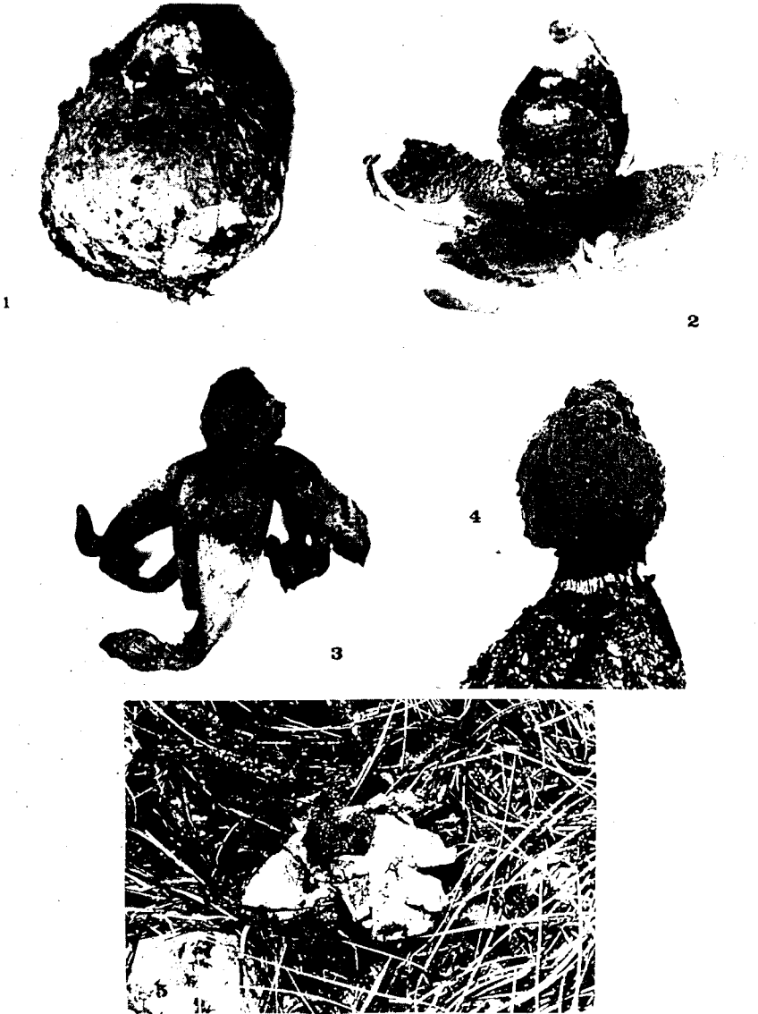
Geastrum melanocephalum (Czern.) Stanek f. melanocephalum .

1 : jeune carpophore ; 2 : carpophore au début de son ouverture ; 3 : carpophore à maturité (exsiccatum) ; 4 : gléba ; 5 : carpophore à maturité in situ. — 1 et 5 : photo L.R. ; 2, 3 et 4 : photo A.C.