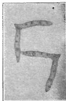
Feuille de Carex alpestris .

prairie alpine. Les stations de crêtes, rochers, nous donnent des feuilles cylindriques, avec Carex curvula , Elyna carycina , Bellardi , ou des feuilles recourbées sur la nervure médiane, avec C. rupestris , C. nigra . On note le développement des parenchymes palissadiques, et des îlots sclérisés dans les limbes. Les prairies plus ou moins humides des combes, les rochers suintants (Ass. à C. ferruginea , Ass. à C. firma ) ont des carex à structure nettement différente : feuille plane à nervure médiane, peu saillante, tissu lacuneux important dans les limbes avec faible parenchyme palissadique ( C. ferruginea , frigida , firma , fatida ), sclérenchyme très réduit.