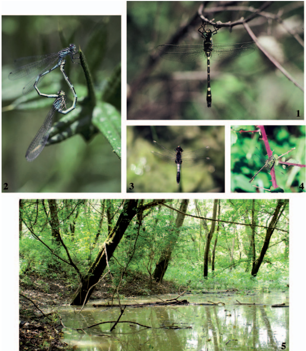
Planche II – Odonates rhônalpins. 1 : Macromia splendens sur la rivière Ardèche à Salavas (07) ; 2 : Coenagrion ornatum à Aigueperse (69) dans le Haut-Beaujolais ; 3 : Leucorrhinia caudalis à Charette (38) en Île-Crémieu ; 4 : Gomphus flavipes sur le Rhône, île du Beurre à Tupin-et-Semons (69) ; 5 : marais alluvial.