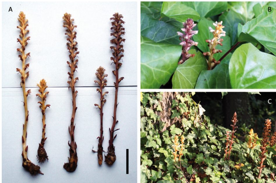
Figure 1. Orobanche hederæ (Lyon-Fourvière).

Notons enfin que dans les populations lyonnaises la proportion des morphes varie entre années (même si la forme hypochrome reste dominante ; observations de 2002 à 2009), alors que chez les Protea sus-mentionnées elle est plus ou moins constante.