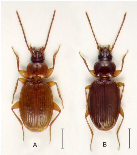
Figure 1 : Habitus mâle des deux espèces de Trechus du groupe algiricus : (A) Trechus echarouxi n. sp. du djebel Goraa (Tunisie) et (B) Trechus algiricus Jeannel, 1922 provenant de la Zaouia de Mouzzaïa, région de Blida (Algérie). Barre d'échelle = 1,4 mm.