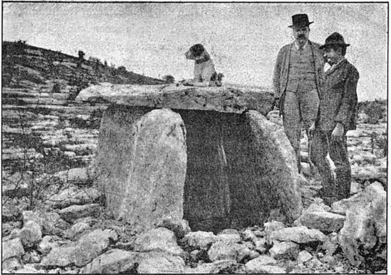
FIG. 3. -- Dolmen situé sur la rive gauche du ruisseau de Fon-Méjanne, entre Chandolas et Saint-Alban-sous-Sampzon.

Près des vertèbres cervicales gisaient des perles en os, quinze