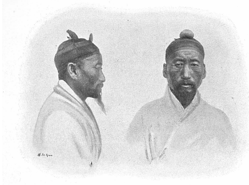
PAK-TCHANG-SIX, 38 ans.