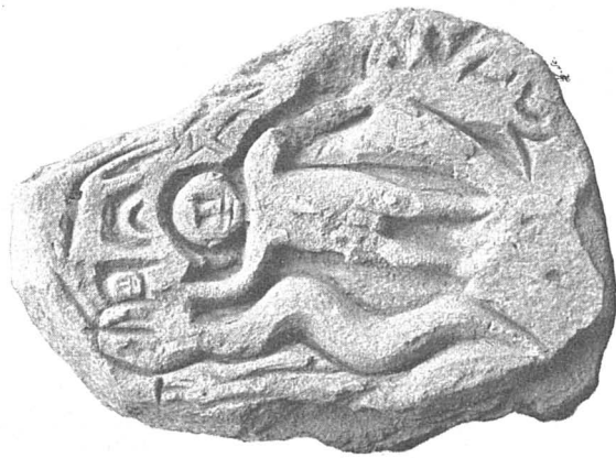
Sculptures de Veysillière.