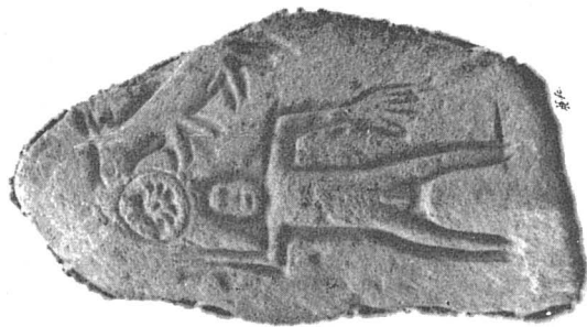
Sculptures de Panossas.