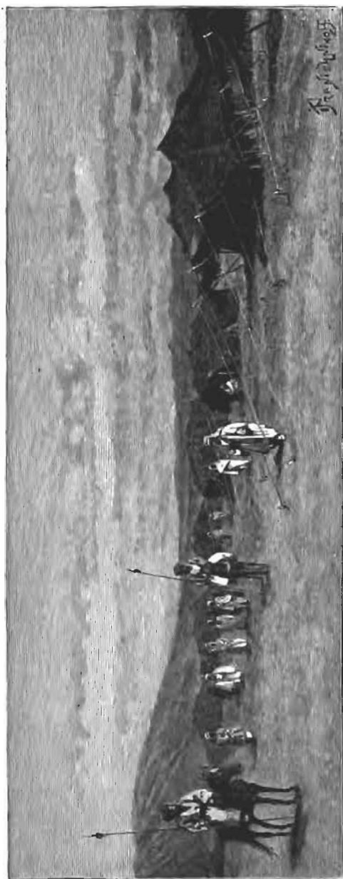
Campement kurde de Merjiri-Khan, près d'Orfa. Kurdes et Bédouins.