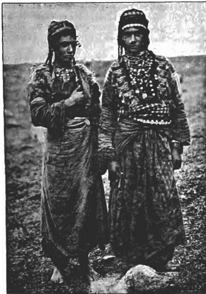
Femmes Kurdes Djelali Campement de Sardon-Boulak.

Elle prend le nom de bysak qui signifie : « attends, tu me payeras ça ! » C'est cette coutume qui les oblige d'être toujours armés et