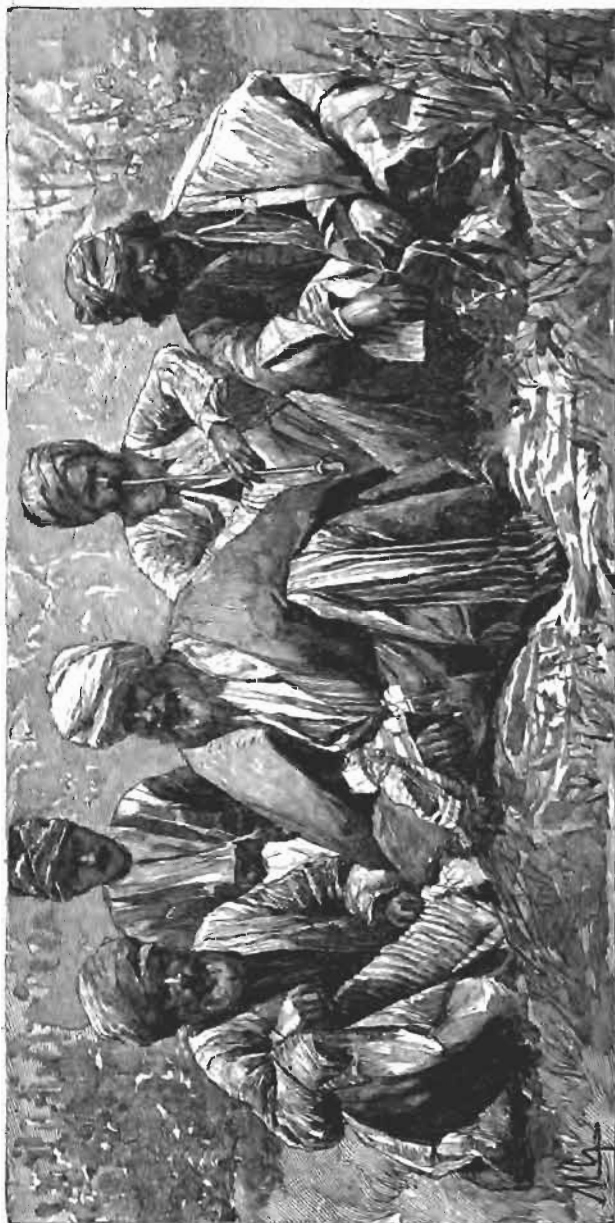
Kurdes Dudas (Village d'Ola sur le Tigre).