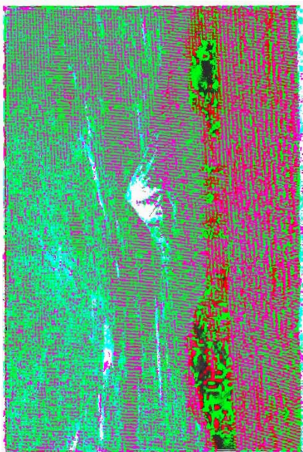
Le campement kurde de Sardav-Boulak au pied de l'Ararat.

le chef de la tribu. Ce supérieur, appelé ruspi , faisait rentrer les impôts et jugeait les petites affaires, assisté des vieillards de la Société.