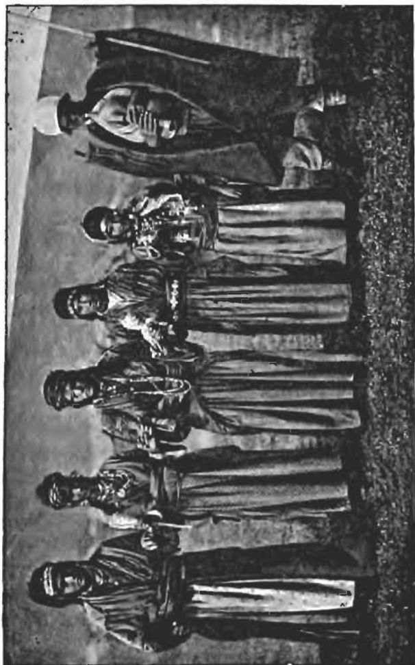
Danse des Kurdes Bourouki. Campement d'Aïridja, au sud-est du lac Goktchai.

La principale occupation des nomades est l'élevage des brebis. Des troupeaux de 1500 moutons et brebis ne sont pas rares. Aussi être berger est une occupation fort honorable, et les plus expéri-