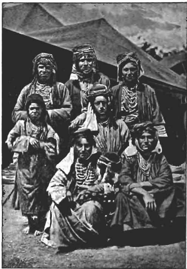
Femmes Kurdes Djelali Campement de Petchara, versant perse de l'Ararat.

maison arménienne. Seul le vin manquait. Mais il se pourrait que, parmi ces Radkis, quelques familles soient précisément d'origine