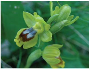
- 14 -