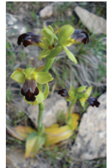
- 19 -

Planche 2 (Photos A. Madoui, sauf les figures 14-17-18-19 qui sont de K. Rebbas).