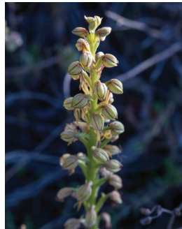
- 27 -