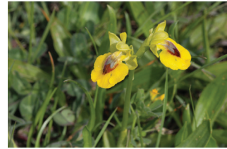
- 16 -