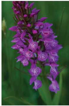
- 6 -