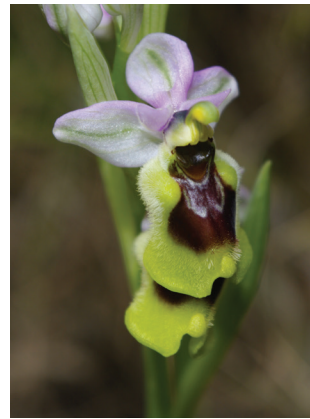
- 25 -