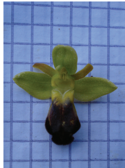
- 18 -