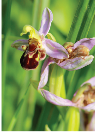
- 12 -