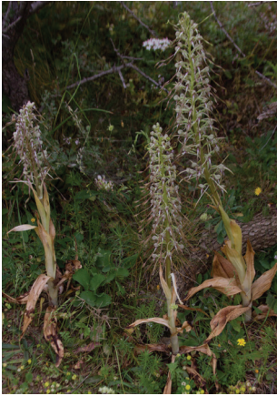
- 11 -