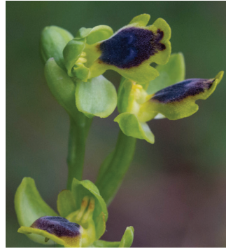
- 22 -