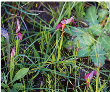
- 35 -