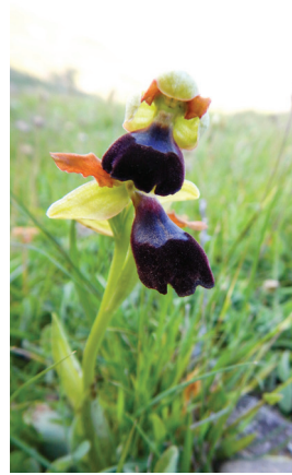
- 13 -