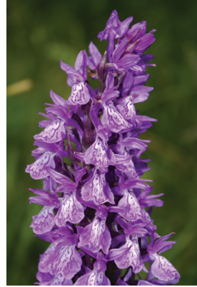
- 7 -