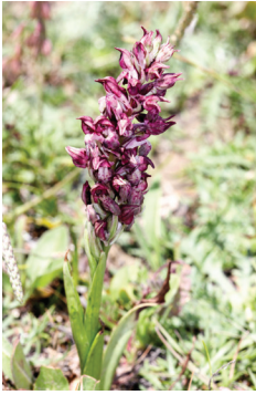
- 2 -