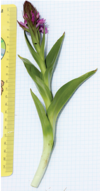
- 8 -