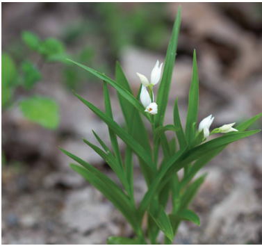
- 5 -