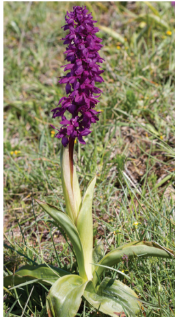
- 33 -