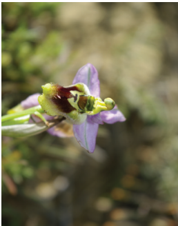
- 26 -