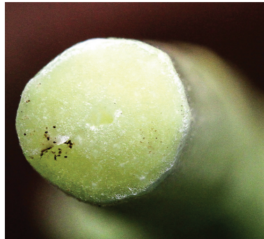
- 10 -