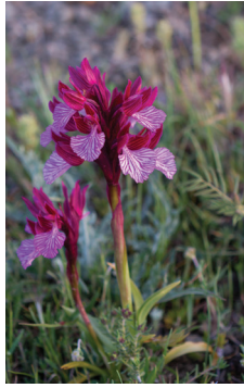
- 3 -