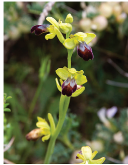
- 15 -