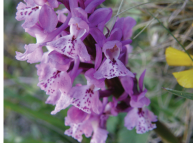
- 31 -