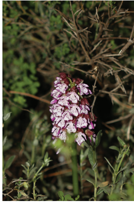
- 30 -