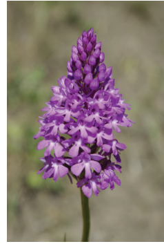
- 4 -