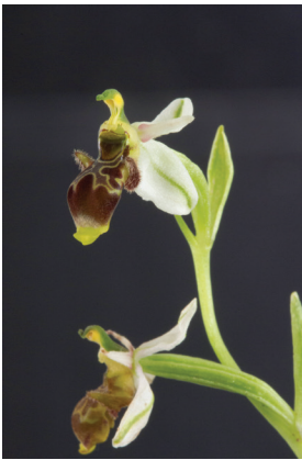
- 23 -