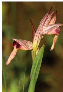
- 36 -