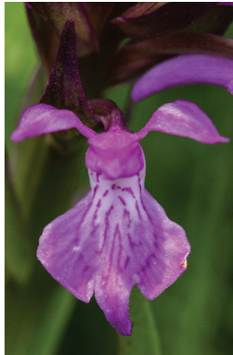
- 9 -