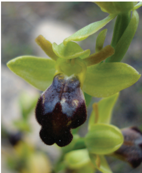
- 17 -