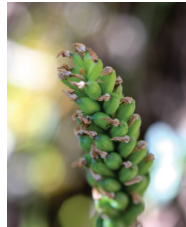
- 28 -