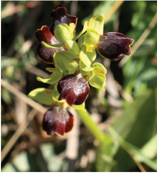
- 20 -