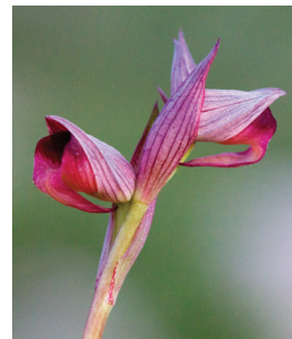
- 37 -