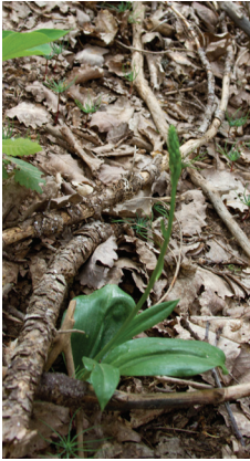
- 29 -