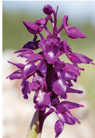
- 34 -