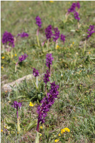
- 32 -