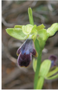
- 21 -