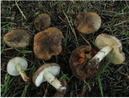
Lepiota andegavensis Mornand