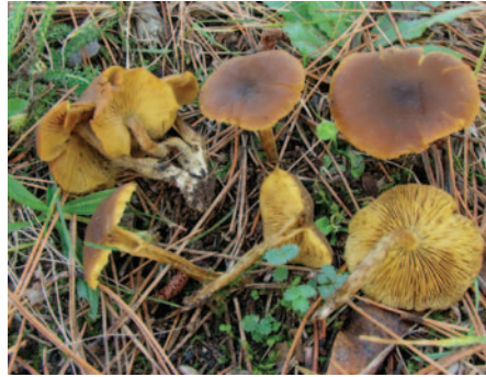
Callistosporium luteo-olivaceum (Berk. & M.A. Curtis) Singer