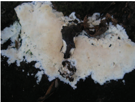
Trechispora farinacea (Pers.) Libertá