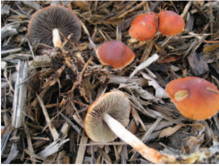
Leratiomyces ceres (Cooke & Massee) Spooner & Bridge