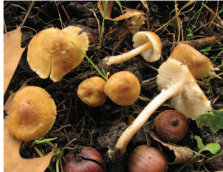
Inocybe amygdalospora Métrod ex Cheype & Contu