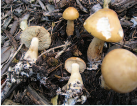
Agrocybe putaminum (Maire) Singer