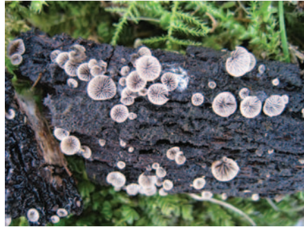
Resupinatus trichotis (Pers.) Singer