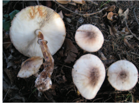
Leucoagaricus bahamii (Berk. & Broome) Singer