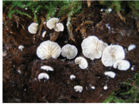
Clitopilus daamsii Noordel