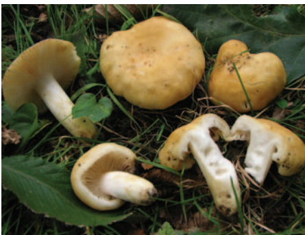
Russula farinipes Romell