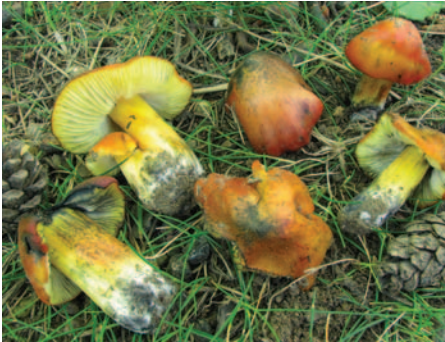
Hygrocybe pseudoconica J.E. Lange