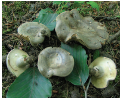
Lactarius fluens Boud.