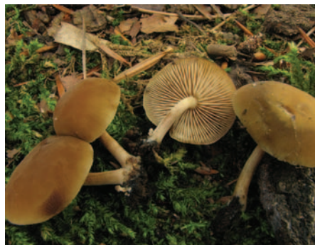
Simocybe centunculus (Fr.) P. Karst