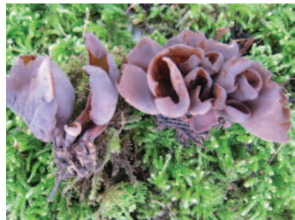
Otidea bufonia (Pers.) Boud.