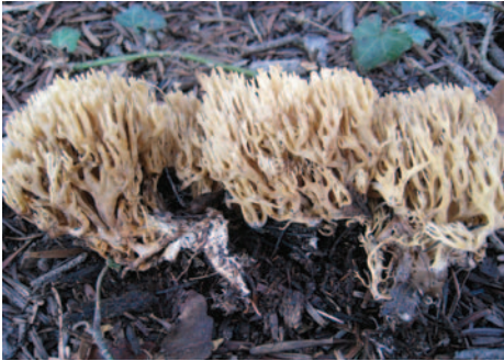
Ramaria myceliosa (Peck) Corner