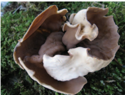
Otidea alutacea var. parvispora Parslow & Spooner