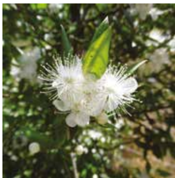
Figure 5. Myrtus communis Linné, 1753, en fleur