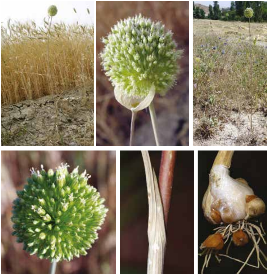
Figure 3. Illustrations d' Allium scaberrimum forme blanche, au stade floral. Localité de Ouanougha, 04.7.2018 : Port (en haut à gauche) et inflorescence avec spathe (en haut au centre). Localité d'Ain Loulou, 03.7.2018 : Port (en haut à droite), feuille sèche (en bas au centre), bulbe avec caïeux (en bas à droite). Localité de Tafrent, 21.6.2019 : inflorescence (en bas à gauche).

Les principales menaces pesant aujourd'hui sur cette espèce dans les trois régions étudiées (Aurès, monts du Hodna et Hautes plaines oranaises) sont liés à l'urbanisation diffuse et au changement d'usage des terres traditionnelles, car la plupart des champs de céréales sont proches des routes et des villages : extension des villages, construction d'habitations secondaires, conversion d'une agriculture céréalière de plein champ vers une agriculture vivrière de vergers, etc.