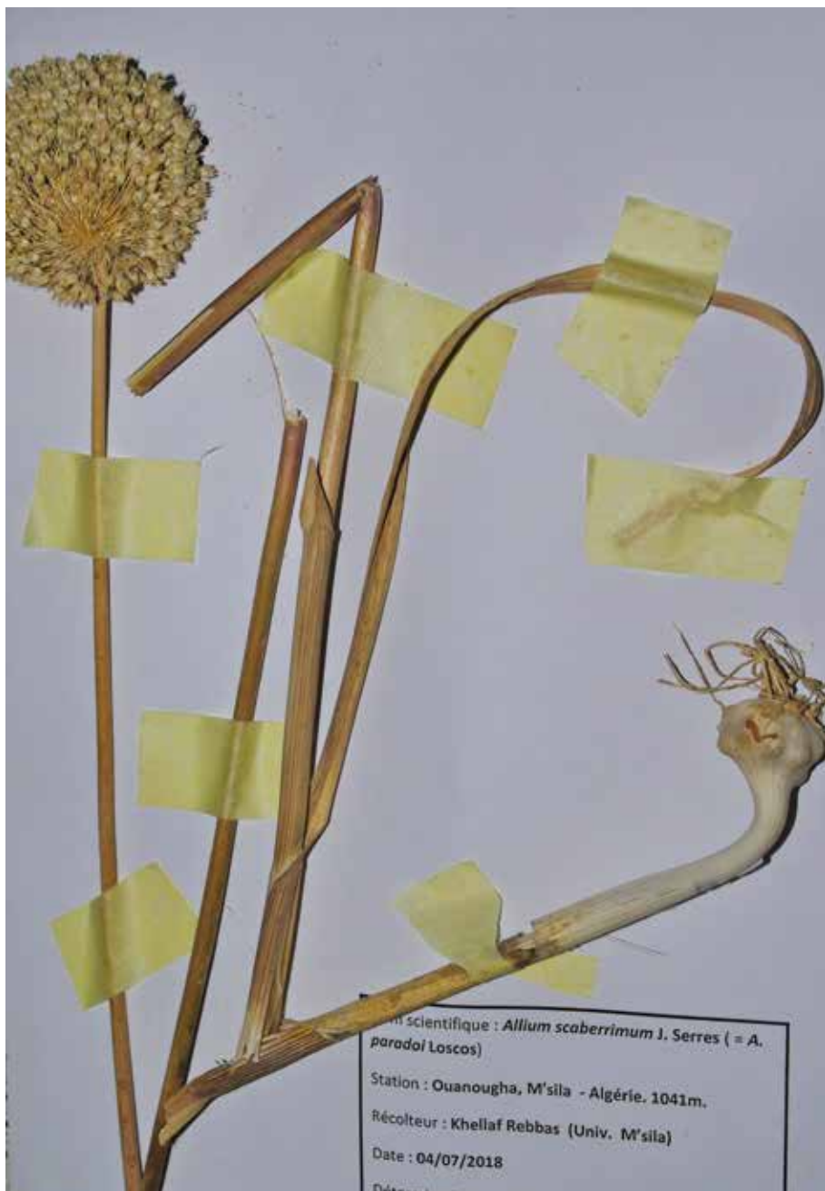
Figure 1b. Planche d' Allium scaberrimum de Ouanougha, déposée à l'herbier ENSA.