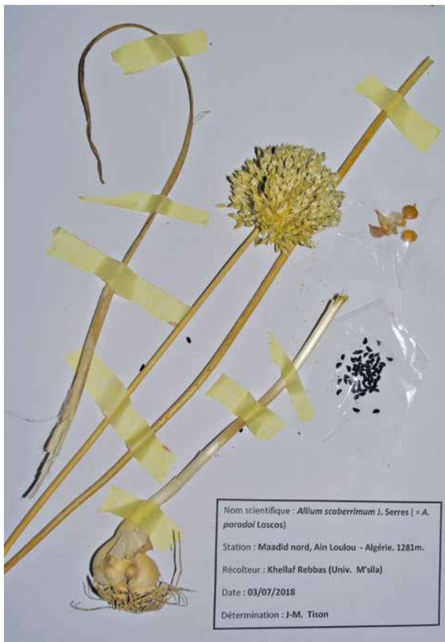
Figure 1a. Planche d' Allium scaberrimum de Maadid nord, déposée à l'herbier ENSA.