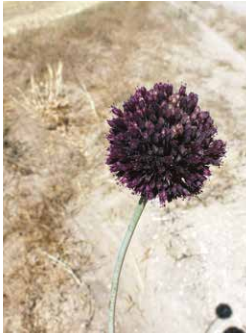
Figure 2. Allium scaberrimum forme pourpre, Dayet el Ferd, 26/06/2013.

Ce poireau fleurit en juin (nord de l'Algérie) ou en juin et juillet (France). Il pousse dans les champs de céréales et sur les bords des routes en contexte agricole (BATTANDIER & TRABUT, 1895 ; MOLERO BRIONES, 2004 ; DE BOLOS & VIGO, 2001). Il croît entre 150 et 1200 m en France (SILENE, 2015) et entre 1000 et 1400 m en Algérie (MAIRE, 1958 ; présent travail). La longueur de la génération est estimée à cinq ans (la plante se reproduit en moyenne entre deux et dix ans, J.-M. Tison obs. pers.). Les bulbes principaux maintiennent parfois les individus matures, bien que l'espèce se comporte souvent en monocarpique, tandis que de nombreuses bulbilles aident à la dispersion grâce au labour. Sa floraison n'apparaît que certaines années, en densité très variable, alors que la multiplication végétative au stade juvénile est permanente et le plus souvent cryptique (les individus ne sont plus visibles à partir d'avril), ce qui contribue largement à la sous-observation de l'espèce. Comme son habitat continue à décliner, en particulier à cause de la destruction suite aux changements d'utilisation des sols et à la fragmentation du paysage, l'espèce est considérée comme sévèrement fragmentée et menacée d'extinction sous la catégorie « vulnérable » (MOLINA et al. , 2018).