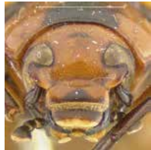
- 2d -