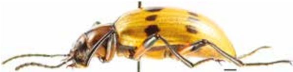
- 1c -