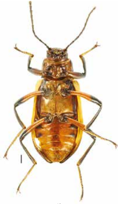
- 1b -