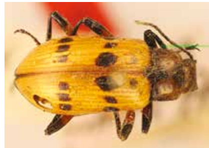
- 1f -