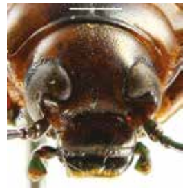
- 1d -