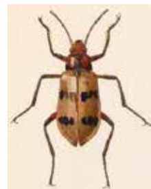
- 2f -