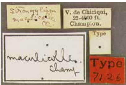
- 2e -