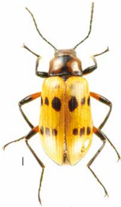
- 1a -