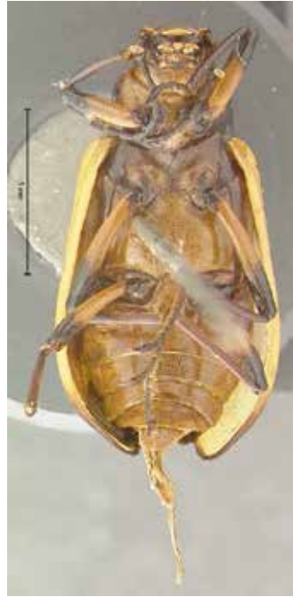
- 2b -