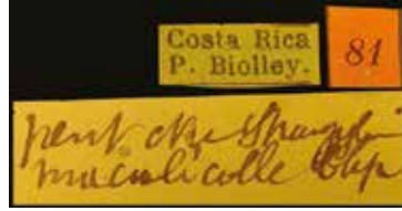
- 3b -