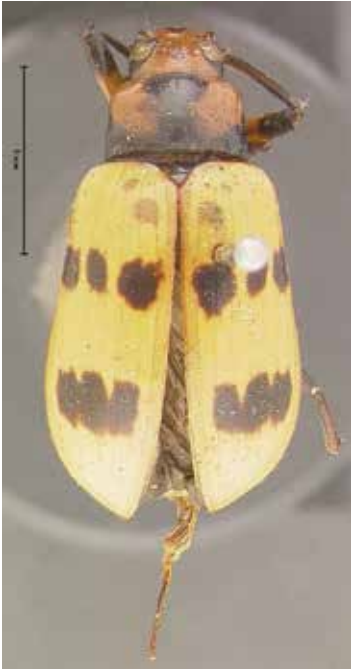
- 2a -