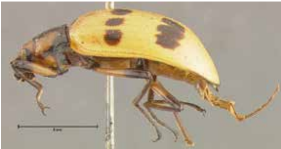
- 2c -