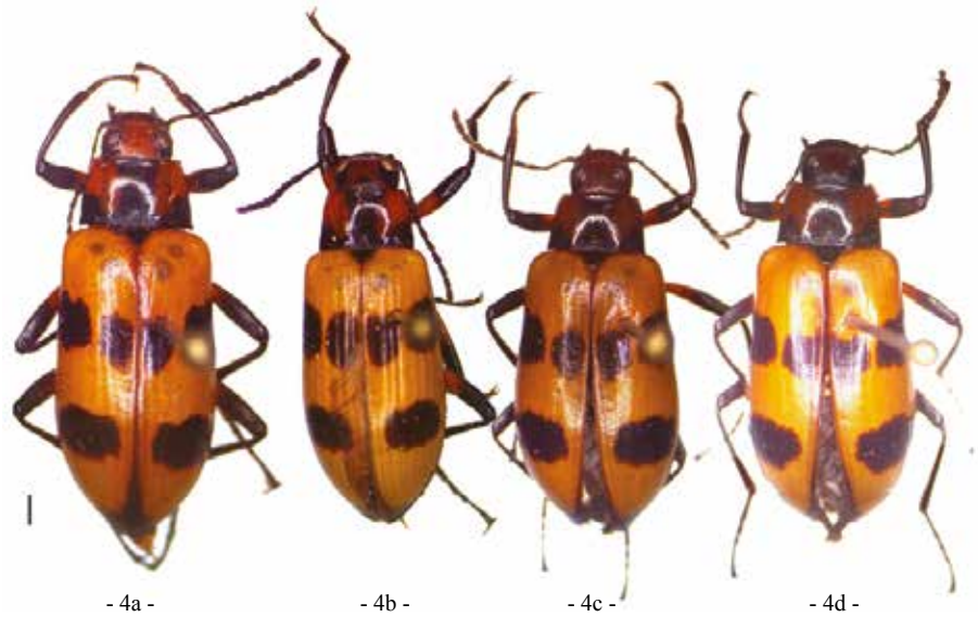
- 4a -