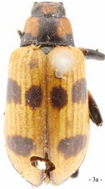
- 3a -